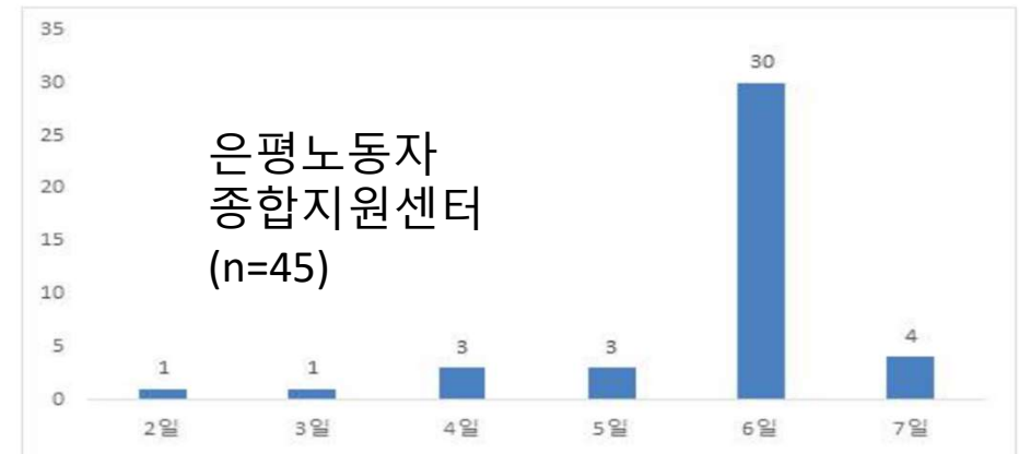
〈그림 Ⅲ-2〉 라이더의 주당 근무일 수

○ 하루 평균 업무 시간에 대하여 확인해 본 결과, 1일 기준으로 평일근무는 일반적으로 9시간 이상 일하는 사람이 응답자의 60%를 넘어 기준 근로시간을 초과하여 일하고 있음이 확인되었고, 주말에는 응답자의 57.8%가 9시간 이상 일하는 사람이 있는 것으로 확인됨.