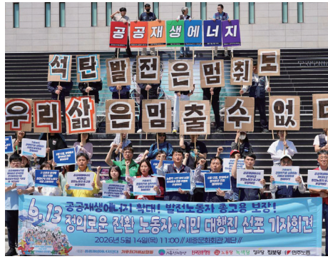
▲ 2026.5.14. 세종문화회관앞에서 개최된 정의로운 전환을 위한 613 노동자·시민 대행진 선포 기자회견.