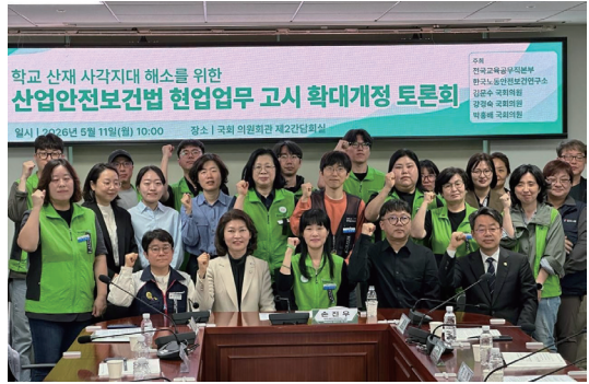
▲ 2026.5.11. 한국노동안전보건연구소와 전국교육공무직본부는 국회 의원회관에서 <학교 산재 사각지대 해소를 위한 산업안전보건법 현업업무 고시 확대개정 토론회>를 개최했다.