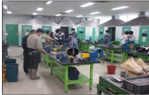
실습 중인 교사