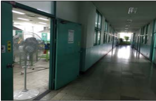
실습실 외부로 유해물질 확산·오염