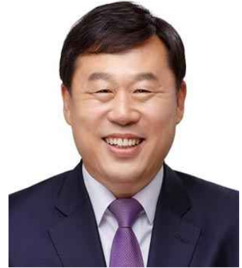
김종훈 민중당 국회의원